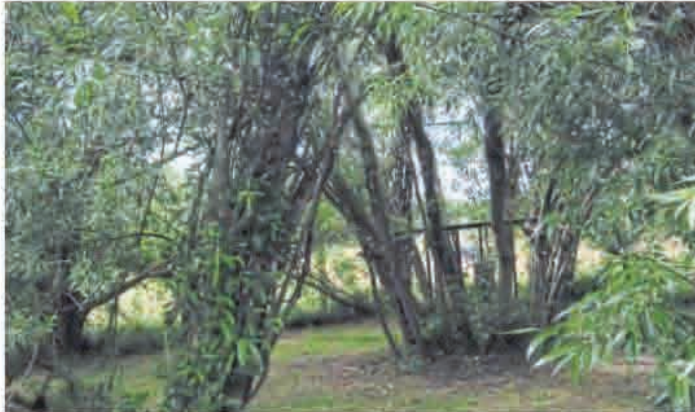
Die Weidenpinne war eins der ersten Pflanzprojekte bei der Anlegung des Gartens.

2003 wurde damit begonnen, aus der ehemaligen Schafwiese direkt am Anfang des Moorerlebnispfads an der Naturschutzstation ein Refugium für die Tier- und Pflanzenwelt zu schaffen. Gleichzeitig sollte es auch ein Ort werden, der Wanderer, Radfahrer oder Garteninteressierte der zum Verweilen einlädt. „Diese Stelle war erst einmal absolut kahl“, erinnert sich Ulrike Marxmeier. Doch mit dem Anlegen der Weidenspinne oder auch Weidenzelt begann die optische Veränderung. Aus 24 Astbündeln, die tief in den Boden gerammt wurden, entstand eine Konstruktion, die begehbar ist und im Inneren das Gefühl erweckt, man stehe in einem Zeit- oder unter einer Kuppel. Sozusagen eine natürliche Gartenlaube. Zum Anlegen der Pflanzen-