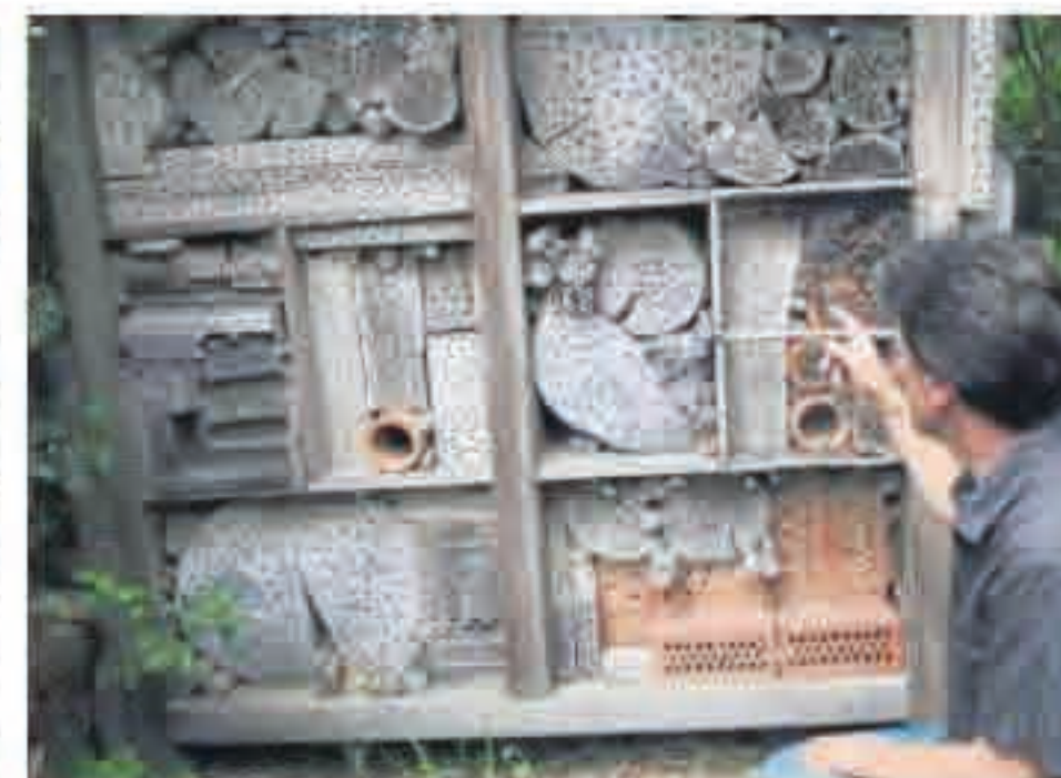
Verschiedene angebohrte Holzstücke als Behausung für Wildbienen.