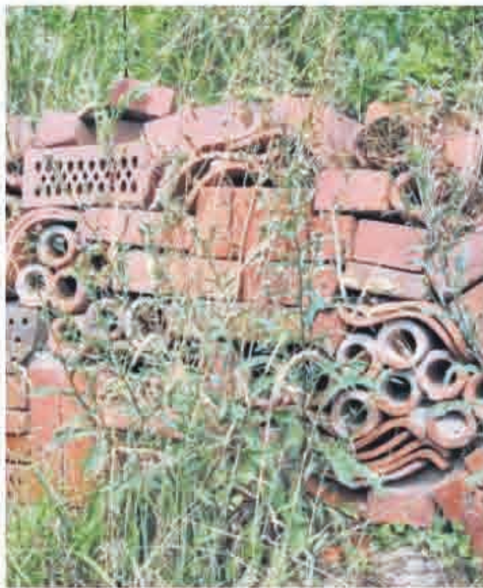
Aus Naturmaterialien entstand ein Insektenunterschlupf.