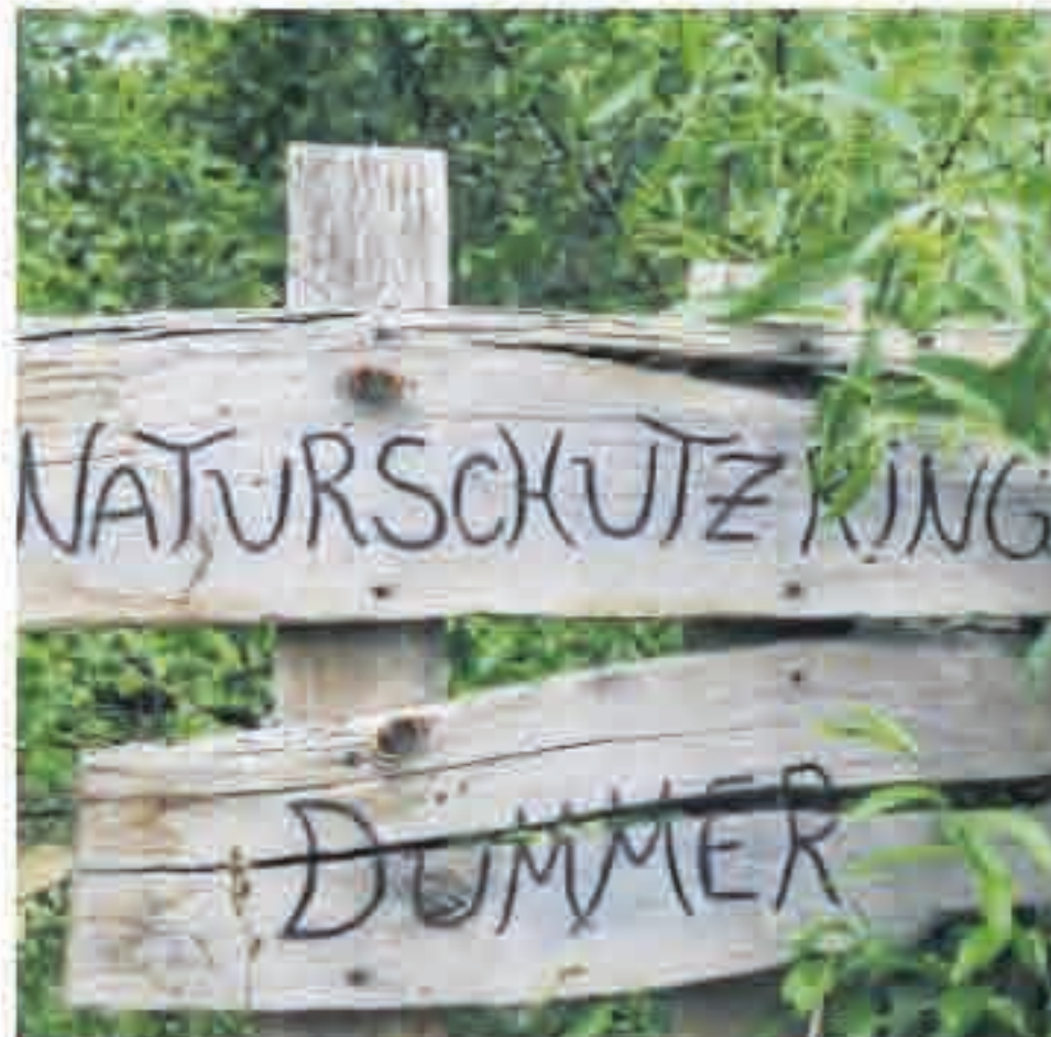
Weit gereist: Schmetterlinge der Gattung Admiral.

besonderen Rezeptvorschlag: Legt man die Blüten über Nacht in Apfelsaft ein, entsteht eine fruchtige Sommerbowle, die gekühlt besonders erfrischend ist. Da die Mädesüß zu den Pflanzenarten gehört, die einen feuchten Untergrund bevorzugen, findet man sie im Naturgarten am Rand eines angelegten Sumpfbeets.