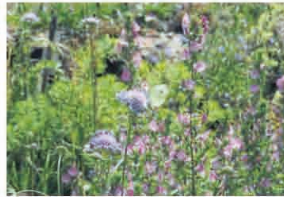
Nicht nur Blütenpracht, sondern auch Nahrung für Insekten.