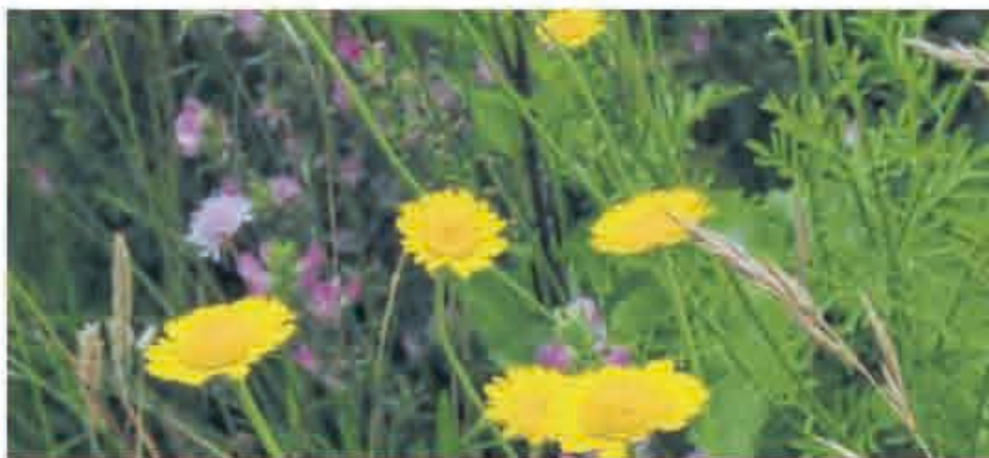
Die Färbekamille leuchtet in ihrem kräftigen Gelbton.