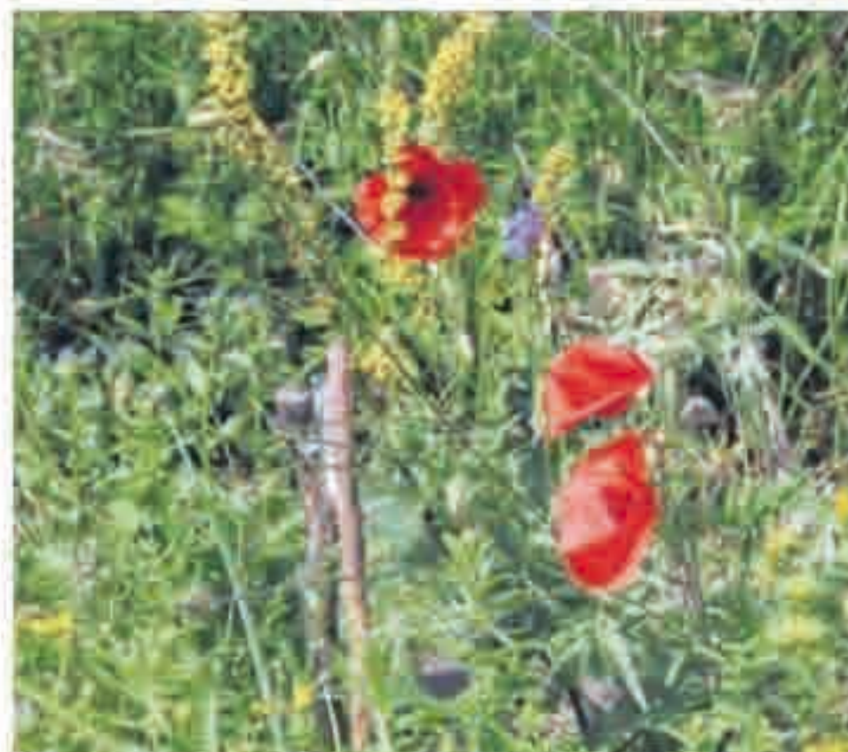
Der rote Klatschmohn findet sich an vielen Stellen im Garten.