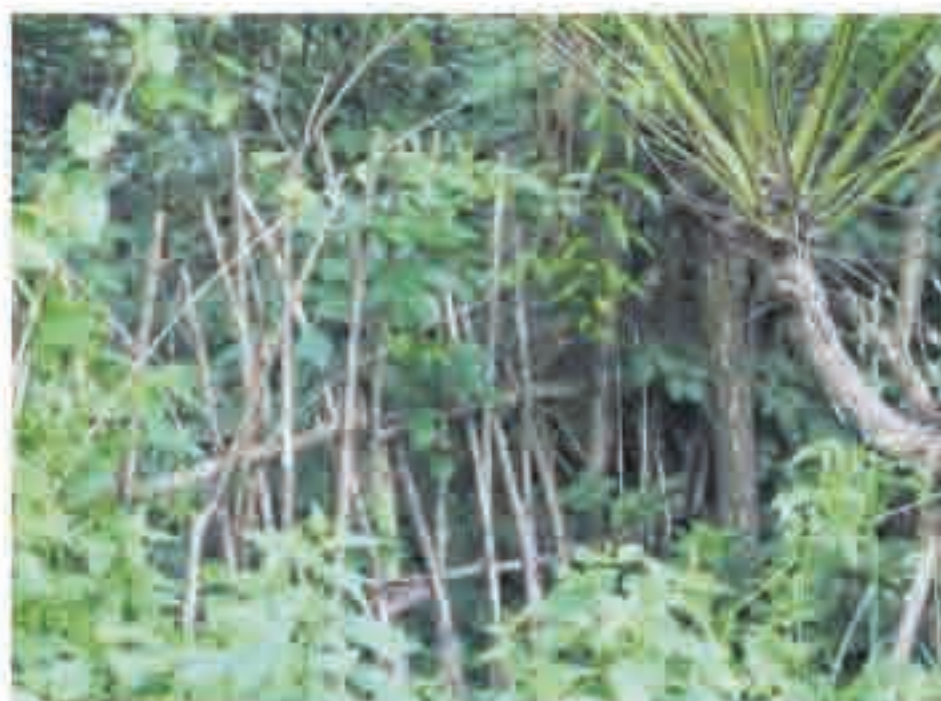
Abgegrenzt ist der Garten mit einem Naturzaun.